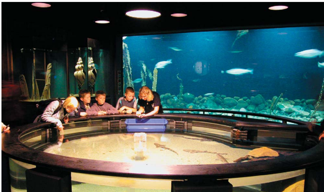
Fiskeri- og Søfartsmuseets nye akvarium, åbnet sommeren 2002.

Efterhånden er der også opstået et markant renoveringsbehov i forhold til museets sælarieafdeling fra 1976. På basis af den trinvis udbygningsplan arbejder museet her på en tilsvarende løsning, som blev anvendt ved akvariet; nedrivning af det eksisterende anlæg og opførelse af et nyt. Projektet, som forventes færdigt til forelæggelse i 2008, opererer med i alt tre hovedelementer, hvoraf det første er anlæg af et nyt sælarium med tilhørende teknik, arbejdsområder og publikumsfaciliteter. I anlægget indgår to nye