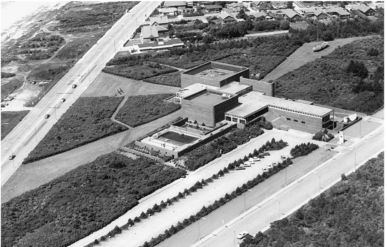
Fiskeri- og Søfartsmuseet omkring 1980.