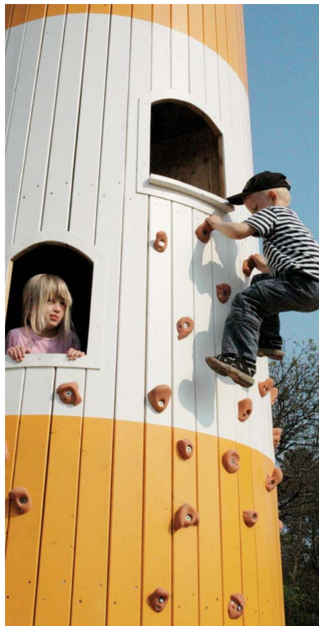
Fiskeri- og Søfartsmuseets nye legeplads, åbnet 2007.

Museets deltagelse i de nævnte organisationer og ordninger har været et nyttigt redskab i tilføjelsen af en serviceorienteret publikumsbetjening til den rent museale virksomhed, som fortsat er institutionens primære formål. Den moderne museumsgæst har ikke blot en bred referenceramme, som sætter stadig større krav til formidlingens kvalitet og substans, men også en opfattelse af museumsbesøget som en totaloplevelse. Ingredienser i denne oplevelse er bl.a. rene og velholdte bygninger og udendørsarealer, gode og rigelige sanitære installationer, synligt og serviceminded frontpersonale, spændende museumsbutikker, kvalitetsbetonede bespisningsmuligheder uden ventetid samt legemuligheder for børnene. Fiskeri- og Søfartsmuseet har løbende fokuseret på disse ting gennem f.eks. uddannelse og uni-