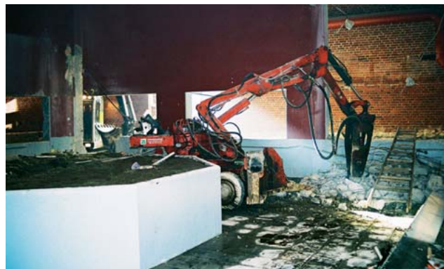
Det gamle akvarium under nedrivning i 2001.

Fiskeri- og Søfartsmuseet udarbejdede derfor - med