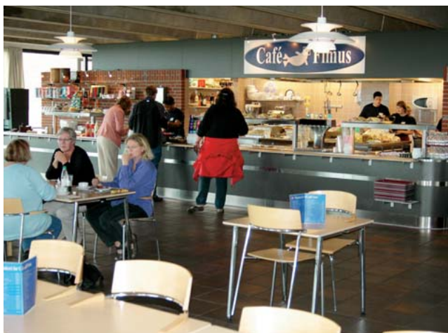
Fiskeri- og Søfartsmuseet overtog i 2006 driften af Café Fimus.

formering af frontpersonale, udarbejdelse af manualer og personalehåndbøger vedrørende procedurer og sikkerhed samt kontinuerlig indarbejdelse af handicapvenlige publikumsfaciliteter ved museets udbygning.