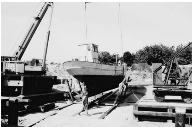
Opbygningen af værft i frilandet i foråret 1990.

kommunale økonomi, der via ordningen om overførsel af eventuelle museale driftsoverskud til kommunekassen satte snævre grænser for museets økonomiske manøvrerfrihed. Allerede i 1988 fremsendte Fiskeri- og Søfartsmuseet de første forhandlingsoplæg herom til Esbjerg Kommune, og i 1990 nåede parterne frem til en ordning om såkaldt økonomisk decentralisering - en såkaldt ØD-aftale. Ordningen indebar, at kommunen påtog sig det økonomiske ansvar for drift og vedligehold af bygningerne i museets kernekompleks og herudover bidrog med et årligt tilskud til den museale drift af institutionen. Ordningens vigtigste punkt var imidlertid, at Fiskeri- og Søfartsmuseet fremover selv kunne disponere over eventuelle driftsoverskud, mens Esbjerg Kommune omvendt blev fritaget for underskudsdekning over for museet. Hermed opnåede Fiskeri- og Søfartsmuseet den økonomiske manøvrerfrihed, som var en forudsætning for både en forretningsmæssig drift af institutionen og for sikring af den fornødne dynamik til udvikling af museet 9 .