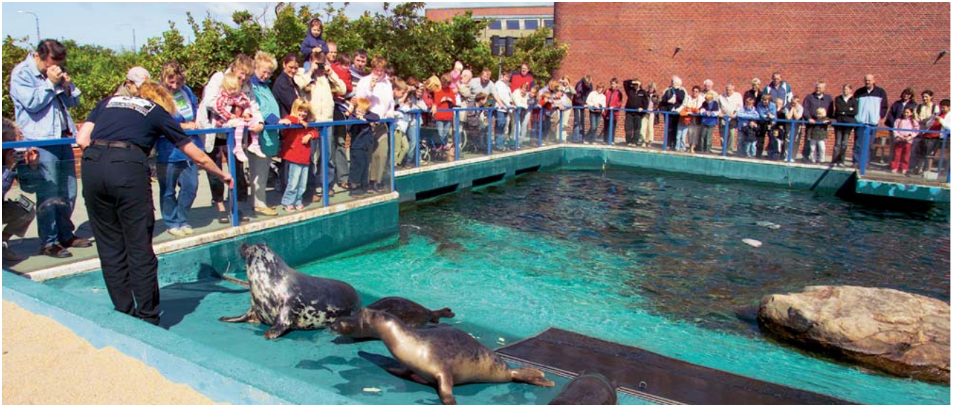
Fiskeri- og Søfartsmuseets sælarium fra 1976 står nu foran fornyelse.